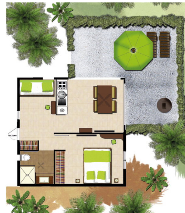
Plan *** + terrasse